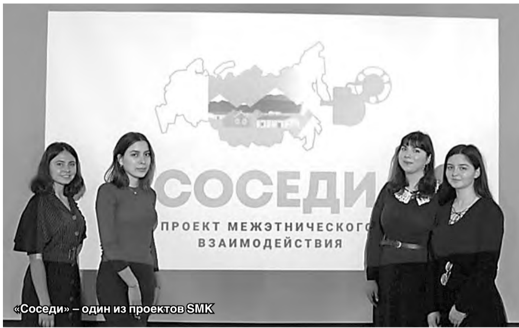
«Соседи» – один из проектов SMK

Выпускники Владикавказской школы межэтнической журналистики (ШМЖ) посетили Республику Ингушетию по приглашению студенческого медиа-кинoclуба (SMK), организованного на базе Ингушского государственного университета.