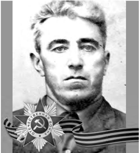
МИСКОВ Ахберд Темболатович (1921–2010)