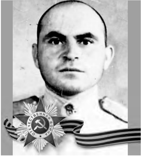
ЗАОЕВ Умар Цирраевич (1911–2003)

НАУКА В ВНИЦ РАН прошел первый межрегиональный семинар институтов сельского хозяйства Северо-Кавказского региона