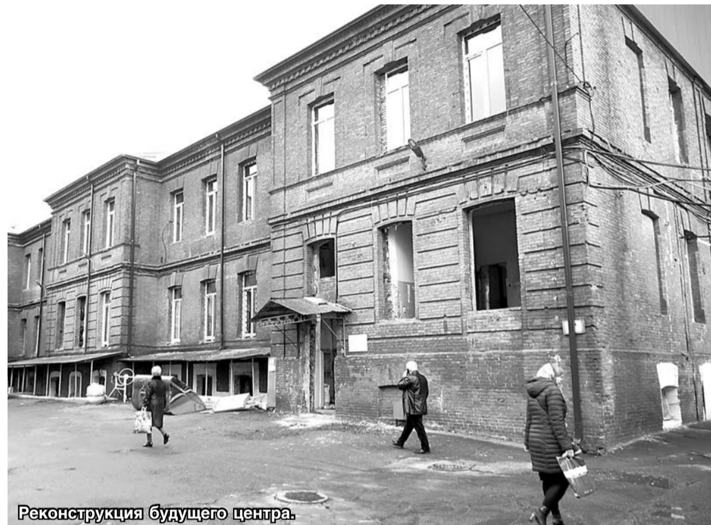
Реконструкция будущего центра.