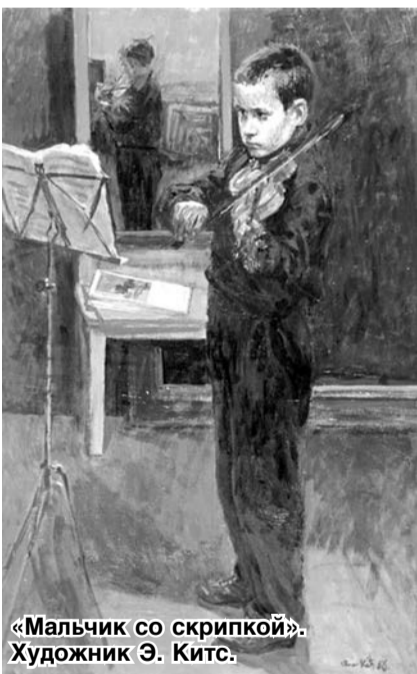
«Мальчик со скрипкой». Художник Э. Китс.