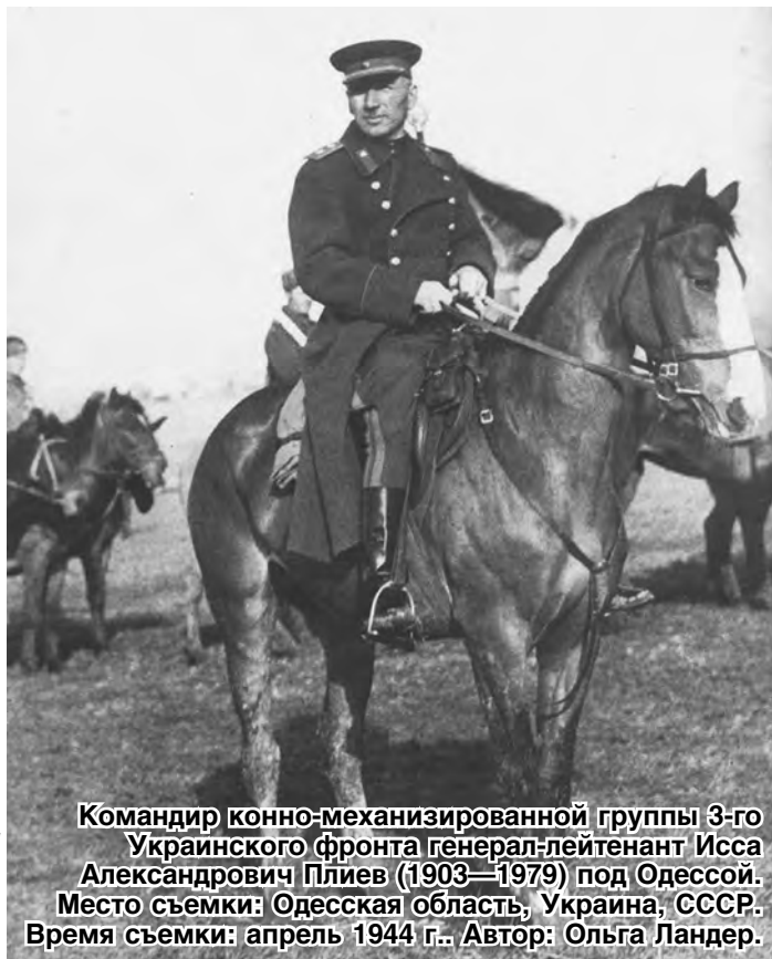
Командир конно-механизированной группы 3-го Украинского фронта генерал-лейтенант Исса Александрович Плиев (1903–1979) под Одессой. Место съемки: Одесская область, Украина, СССР. Время съемки: апрель 1944 г.

«В лице И.А. Плиева мы встретили высококвалифицированного, требовательно и строгого военачальника, замечательного организатора боевых действий крупной группировки, партийного и глубоко принципиального руководителя, человека большого сердца, нежной и благородной души», – отмечал позже руководитель страны Ю. Цеденбал.