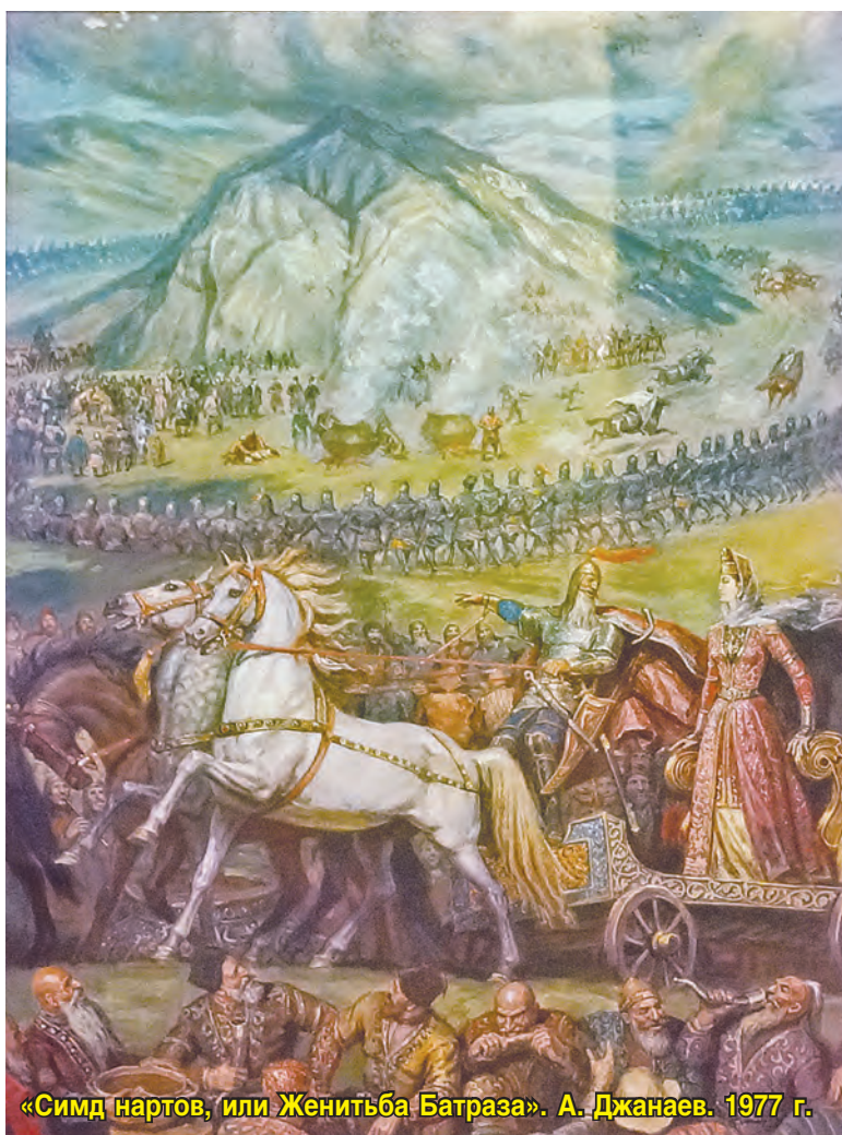
«Симд нартов, или Женитьба Батраза». А. Джанаев. 1977 г.

Елена ТОЛОКОННИКОВА, фото Татьяны ШЕХОДАНОВОЙ.