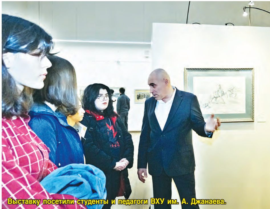
Выставку посетили студенты и педагоги ВХУ им. А. Джанаева.

искусства, ставшие уже знаковыми символами осетинского изобразительного искусства: «Аланы в походе», «Коста Хетагуров — художник», «Византийское посольство у царя алан Саросия», «Осетинское посольство в Санкт-Петербурге в 1749 году». И его изумительные автолитографии и гуаши из знаменитого «Нартовского цикла», созданные в 1940-х и 1970–1980-х годах. И иллюстрации к «Фатиме» и «Охоте за турами» Коста Хетагурова и творчеству Лермонтова. И серия карандаш-