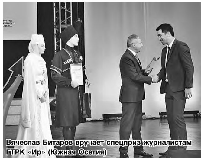
Вячеслав Битаров вручает спецприз журналистам ГТРК «Ир» (Южная Осетия)