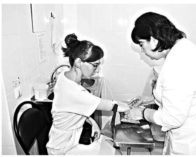
Проводимая работа доказала свою эффективность, и об этом говорят данные исследований. Так, по информации ЕМНЦ, если токсическую нагрузку по свинцу выше уровня озонобезопасности в 2010-2011 гг. имели более половины обследуемых детей, то в 2017 году процент таких детей составил не более 3%.

Во Владикавказе побывали специалисты Екатеринбургского медицинского центра профилактики и охраны здоровья рабочих промышленных предприятий Роспотребнадзора.