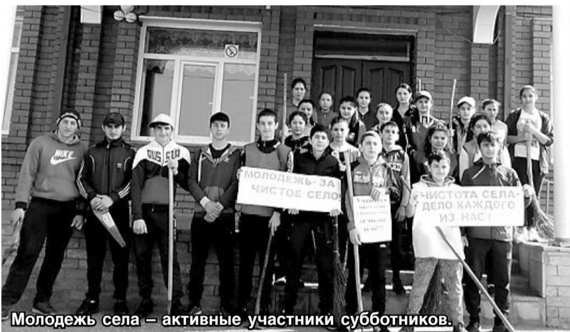
Молодежь села — активные участники субботников.