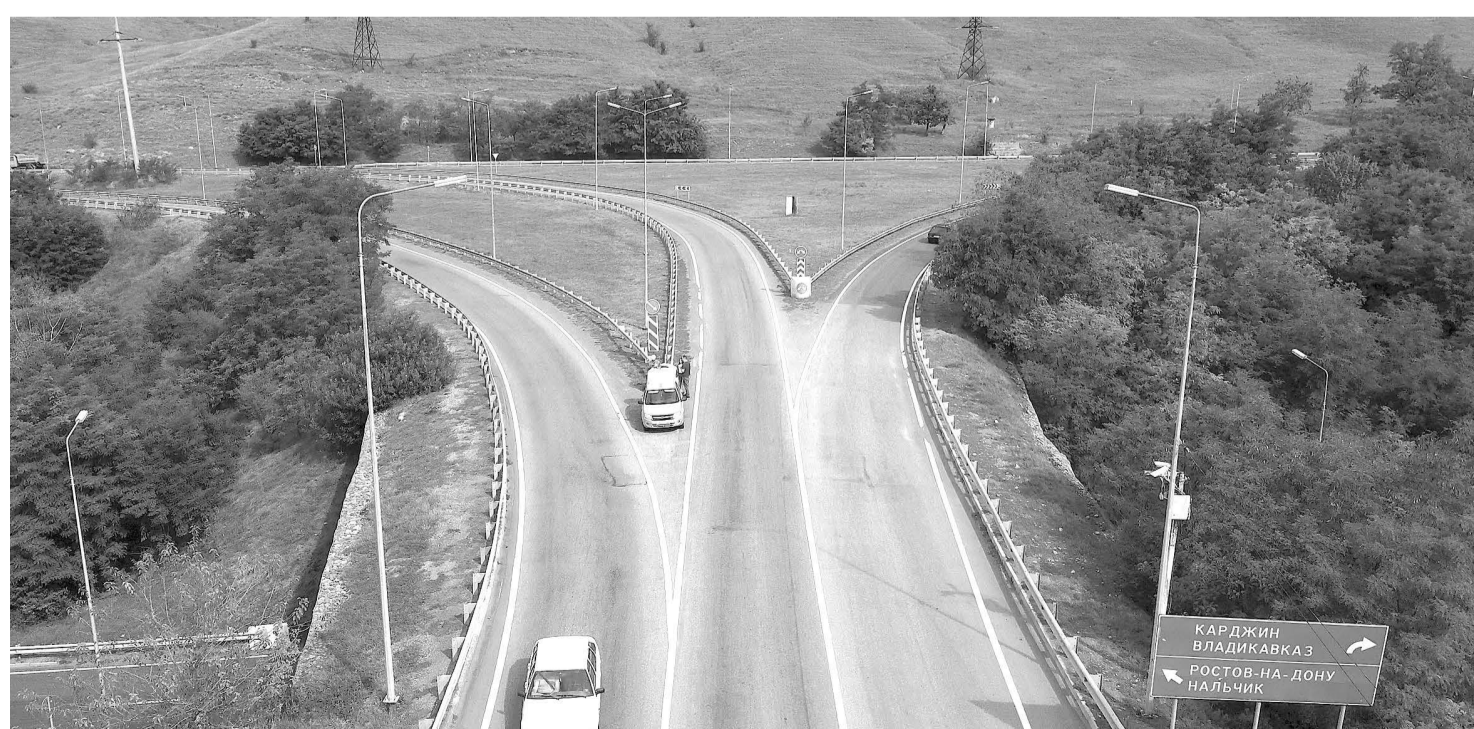
Справка «СО» Автомобильная дорога федерального значения А-164 «Транскам» берет начало в Республике Северная Осетия – Алания от с. Карджина и ведет по Алагирскому ущелью вдоль рек Ардон и Закка. Пролетая горным серпантинном через десяток населенных пунктов, пересекает границу России и Южной Осетии в районе села Нижний Зарамаг, затем проходит через Рокский тоннель, поселок Дау, столицу Южной Осетии – город Цхинвал и заканчивается на границе Южной Осетии и Грузии.

К капитальному ремонту участка трассы дорожники по заказу ФКУ Упрдор «Кавказ» приступят весной текущего года. В ходе работ устроят отвечающее современным стандартам дорожное покрытие с четырехполосным движением. Для этого расширят земляное полотно, заменят и усилят дорожную одежду с устройством верхнего слоя покрытия из щебеночно-мастичного асфальтобетона. Между тремя слоями асфальтобетона уложат геосетку из полимерных материалов для создания армирующей прослойки, что предупредит деформации покрытия. По такому же принципу отремонтируют съезды и примыкания. Отвод воды с проезжей части обеспечат путем устройства водоотводных лотков, а также заменят три водоотводные трубы. Встречные потоки на всем протяжении 8-километрового объекта разделят осевым ограждением, что позволит исключить самый опасный вид ДТП – лобовые столкновения. Заменят почти 3 км металлического барьерного ограждения по краям проезжей части и переустроят 400 м линий электроосвещения рядом с поселком Бекан. К завершению работ нанесут разметку из термопластика и установят новые дорожные знаки с высокими показателями светоотражения. На время производства капремонта движение организуют по двум полосам (по одной в каждую сторону). Ввод объекта в эксплуатацию намечен в ноябре 2024 года.