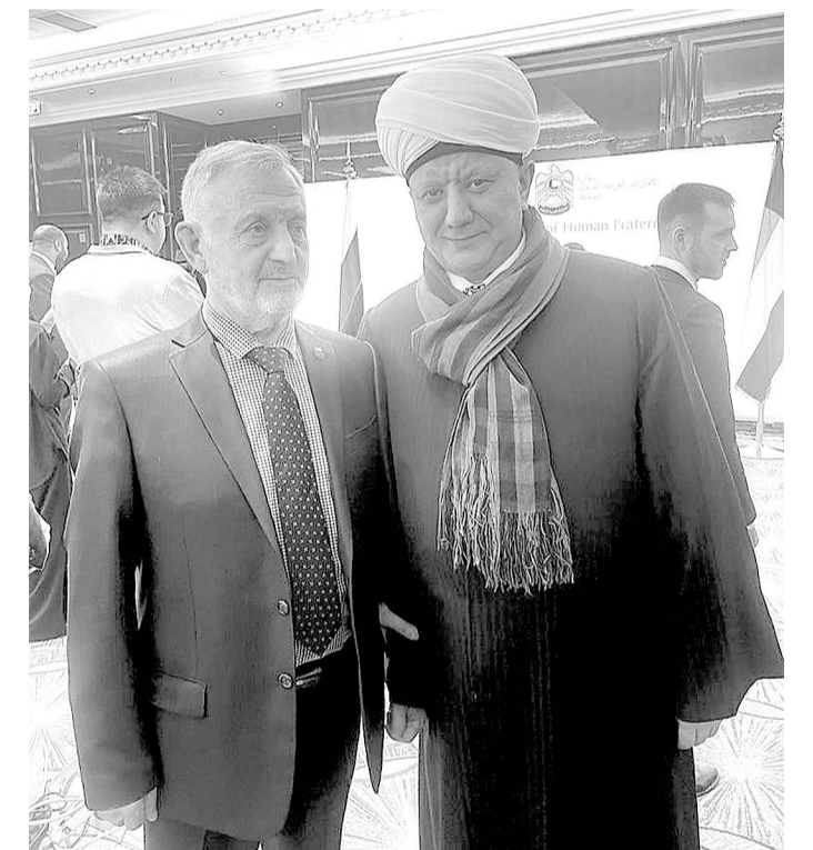
1 февраля в Посольстве Объединенных Арабских Эмиратов в России был организован прием по случаю Международного дня человеческого братства, который отмечается завтра.