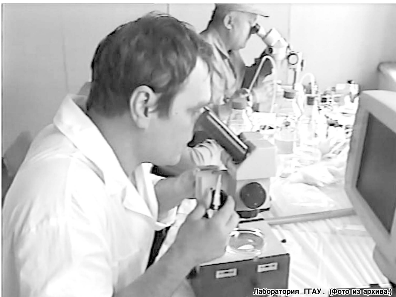
Лаборатория ГГВА.

Невозможно без уважения и восторга смотреть на людей, способных что-то придумать и потом воплотить свою идею в жизнь. И несмотря на то что колесо, автомобиль, телефон и даже робот-пылесос изобретены, в нашей жизни все еще остаются места инновациям. Но и эти места быстро захватывают идеальные молодые люди, которые потом еще и получают господдержку на реализацию своих проектов.