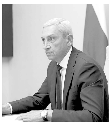
— Необходимо провести анализ наших бюджетных заявок на следующий год. Нужно четко понимать, какие из них уже одобрены, а какие вопросы еще на стадии рассмотрения. Это очень важная совместная работа, которую необходимо оперативно провести.

Председатель Правительства РСО-А также призвал всех руководителей органов исполнительной власти контролировать исполнение мероприятий национальных проектов и государственных про-