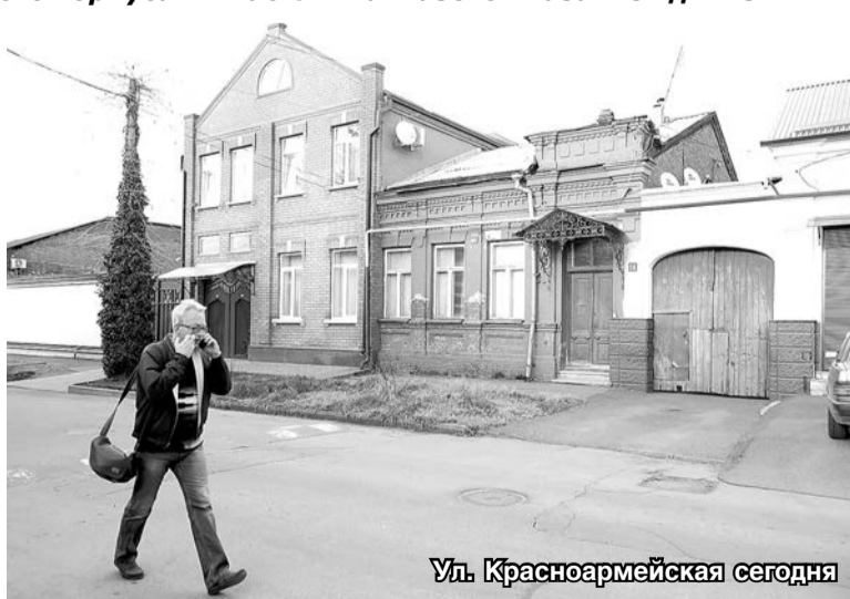
Ул. Красноармейская сегодня

Кроме армейских, в городе постоянно находились казацкие части Терского казачьего войска, а с конца XIX века – Осетинский конный дивизион. Нередко, особенно в праздники, шитые золотом офицерские мундиры и эполеты мелькали на улицах чаще штатских костюмов. Неудивительно, что одна из улиц Владикавказа называлась Офицерской.