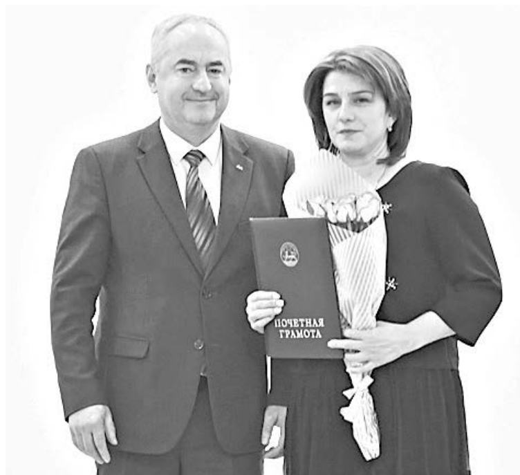
Вчера, в преддверии профессионального праздника, отмечаемого в воскресенье, во Владикавказе прошло награждение и чествование лучших работников жилищно-коммунальной отрасли республики.

Ее составляют более 250 организаций, в которых трудятся свыше трех тысяч человек. Многие из них добросовестно работают в отрасли не одно десятилетие, другие – недавно, но всех их пришли поздравить и выразить благодарность за такой нужный труд руководители органов законодательной и исполнительной власти республики, отрасли и профсоюза.