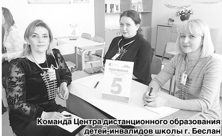
Команда Центра дистанционного образования детей-инвалидов школы г. Беслан