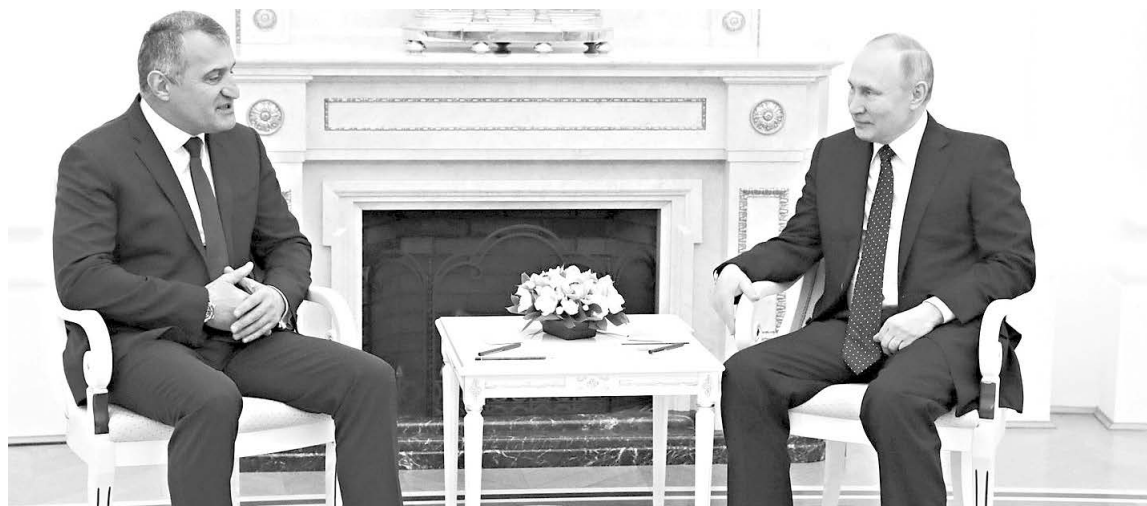
Президент России Владимир ПУТИН встретился в Кремле с югоосетинским коллегой Анатолием БИБИЛОВЫМ. В ходе беседы российский лидер отметил позитивную динамику развития отношений и рост товарооборота двух стран по итогам прошлого года.

«В целом отношения развиваются по восходящей – хорошо. В прошлом году мы зафиксировали рост товарооборота, что тоже не может не радовать. Выполнена инвестиционная программа в объеме 4,27 миллиарда», – сказал Владимир Путин.