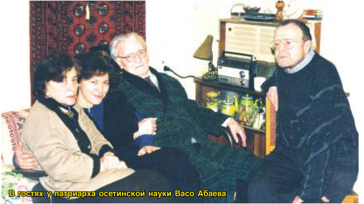
В гостях у патриарха осетинской науки Васо Абаева

был забит до отказа, так как, выходя на сцену, она полностью отдавалась чувствам и эмоциям. Иногда волосы вставали дыбом, когда она музыкой передавала то, что невозможно выразить словами. Так было на ее выступлении в ноябре 2010 года, когда она исполняла композицию «Прерванный полет». Про ее первую часть «Плач матери» композитор сказала так: «Нет ничего страшнее плача матери. Словами невозможно передать чувства, которые испытываешь, потеряв близ-