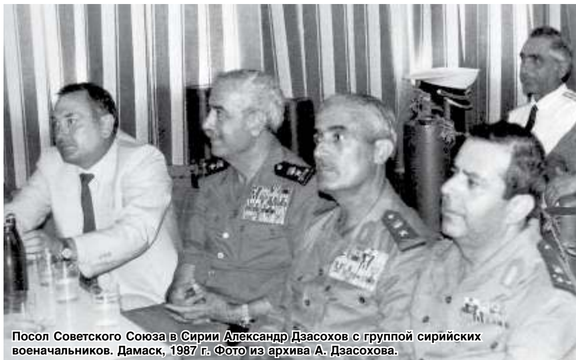
Посол Советского Союза в Сирии Александр Дзасохов с группой сирийских военачальников. Дамаск, 1987 г.

сам, представляющим интерес для МИДа России, и так далее.