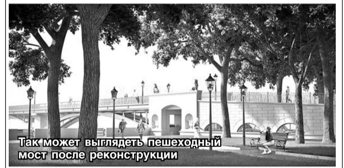
Так может выглядеть пешеходный мост после реконструкции