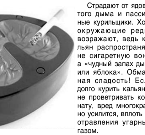
Республиканский центр медицинской профилактики.

Доказать безвредность кальяна стараются фанаты сладкого дыма, приводя массу доводов в его оправдание: мол, в кальянном табаке нет бумаги, выделяющей при горении вредные вещества, табак и содержащиеся в нем ядовитые примеси оставляют в воде... Однако так ли это? Табак, который кладут в чашу курительного аппарата, ничуть не менее вреден, чем тот, что содержится в сигаретах. Научные исследования достоверно подтверждают, что поклонники кальяна страдают теми же самыми заболеваниями, что и обычные курильщики. Речь о заболеваниях органов дыхания, сердца и онкологии.