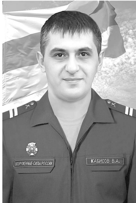
героизм, сражался на Херсонском направлении в составе отдельной гвардейской бригады Крымской группировки. Выполнял боевые задачи в должности командира ав-

После начала СВО принял решение вернуться в строй, защищая Отечество с оружием в руках, подписал контракт и с октября 2022 года, проявляя мужество и