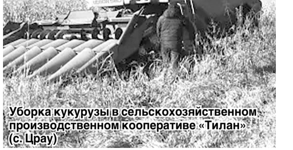
Уборка кукурузы в сельскохозяйственном производственном кооперативе «Тилан» (с. Црпай)

Как показали итоги жатвы и как ожидалось, выше средней урожайности показателя в агрофирме «Агро-Ир», где и в предыдущие годы добивались лучших результатов. Здесь к тому же построили элеватор, рассчитанный на 100 тыс. тонн зерна, установили сушильное оборудование. Это очень важно для сельхозтоваропроизводителя — довести зерно до оптимальной влажности. А затем хранить его до лучших времен, когда спрос на зерно и цена на него достигнут приемлемых значений.