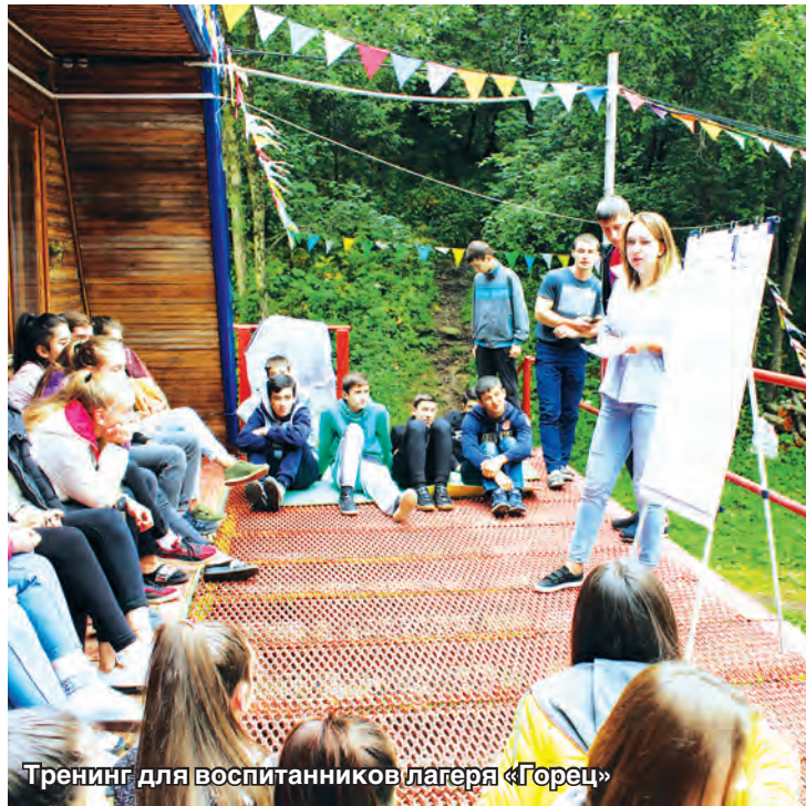
Тренинг для воспитанников лагеря «Горец»

«Несомненное преимущество лагеря «Балц» для ребят в том, что они проходят начальную во-