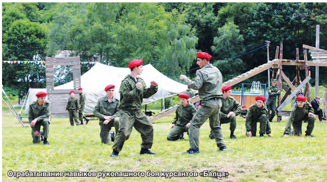
Отрабатывание навыков рукопашного боя курсантов «Балца»

общения – разумеется, «живьем», без применения современных технологий. Единственное, для чего ребятам могут понадобиться их смартфоны – запечатлеть окружающую их красоту Дигорского ущелья – от этого сложно удержаться! 18 дней на свежем горном воздухе, в постоянном процессе познания и полезного досуга, с ежедневной порцией позитивных эмоций и мотивационных мероприятий станут для подростков не просто сменой в лагере, а некой точкой отсчета для перемен в собственном мироощущении. «Программы лагерей рас-