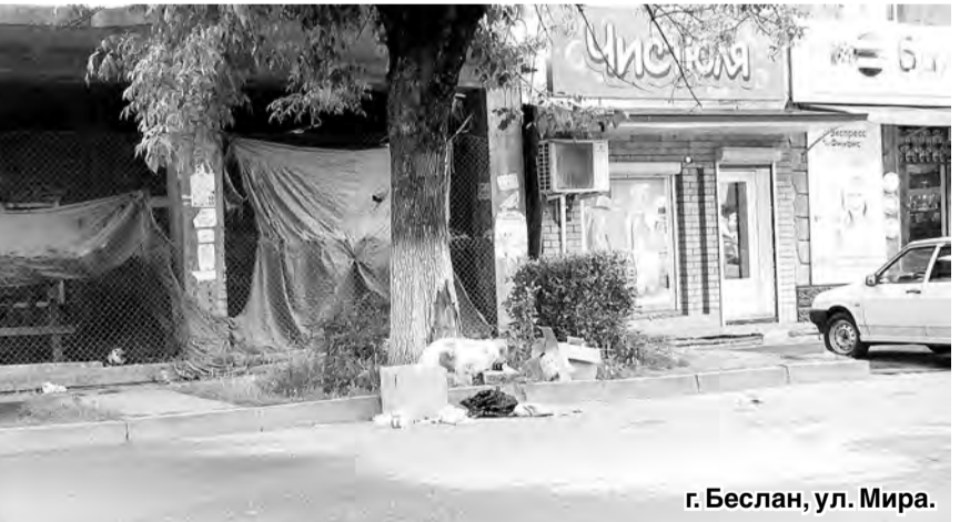
г. Беслан, ул. Мира.

Одна из задач общереспубликанского субботника по благоустройству и озеленению территорий – избавиться населенные пункты Северной Осетии от стихийных свалок. Решить эту проблему не так-то просто.