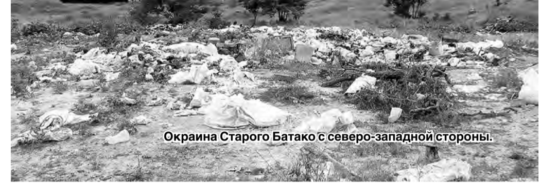
Окраина Старого Батаго с северо-западной стороны.

У въезда в Ардон со стороны Дигоры рядом с железнодорожным переездом находится бывшая автозаправочная станция. На ее территории кругом разбросан мусор. С трассы его тоже хорошо видно.