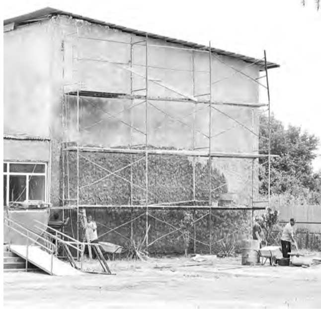
освободившейся площади появятся рабочие помещения и санузлы, которых в доме культуры ранее никогда не было. Полной реконструкции подлежат и вход в здание: будут

Согласно проектно-сметной документации, зрительный зал на 300 мест будет уменьшен почти вдвое. Возможно, на