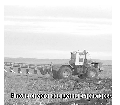
В поле энергонасыщенные тракторы

По информации, предоставленной отделом сельского хозяйства по Кировскому району ГКУ «Управление сельского хозяйства РСО-А» Феликс БЕДОЕВЫМ , местные сельхозпредприятия приступили в эти дни к активной подготовке почвы под сев озимых пшеницы и ячменя.