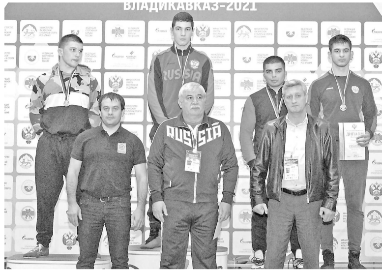
Во Владикавказе, во Дворце спорта «Манеж», с 25 по 29 марта проходило первенство России по вольной борьбе среди юношей до 18 лет. В турнире принимали участие 453 юных борца из 46 регионов страны, оспаривавших медали в 11 весовых категориях.