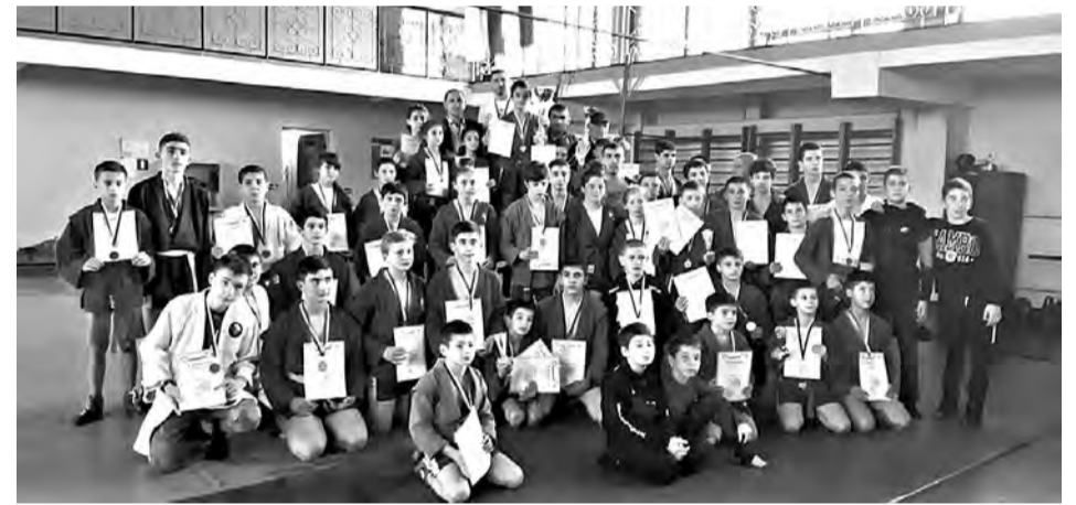
Подготовила Залина ГУБУРОВА.

В Северной Осетии много таких мест, где могут быть применены возможности велопробега. Пожалуй, причин более чем достаточно, чтобы перенимать такой полезный опыт!