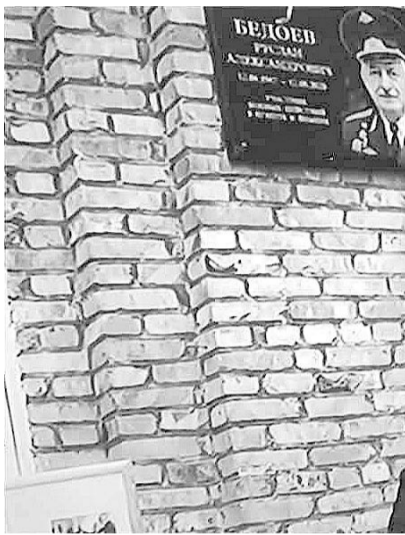
авиационном военном училище. А дальше — военная академия имени Ю. А. Гагарина. Блестящая карьера летчика, умение работать с подчи-