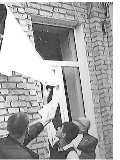
председатель Совета ветеранов г. Владикавказа) была создана оперативная группа ветеранов Великой Отечественной войны, в которую