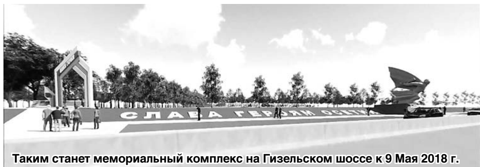
Таким станет мемориальный комплекс на Гизельском шоссе к 9 Мая 2018 г.