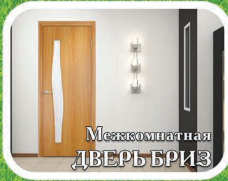
Межкомнатная ДВЕРЬ БРИЗ