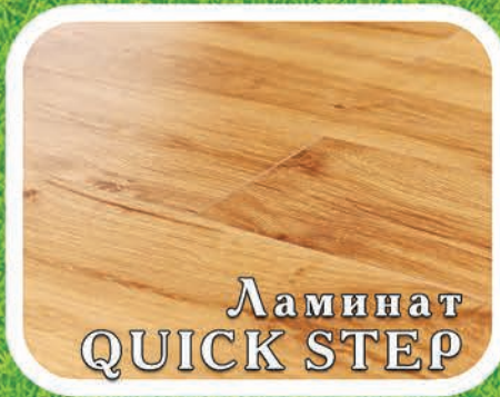
Ламинат QUICK STEP