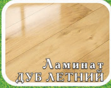
Ламинат ДУБ ЛЕТНИЙ