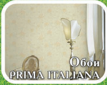
Обои PRIMA ITALIANA