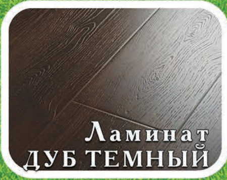
Ламинат ДУБ ТЕМНЫЙ