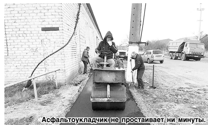
Асфальтоукладчик не простаивает ни минуты.

В Эльхотово вдоль проезжей части дороги по улице Морьяков, от ее пересечения с улицами Братьев Бароевых и Ахболат Карсанова, ведется обустройство тротуара протяженностью два с половиной километра.