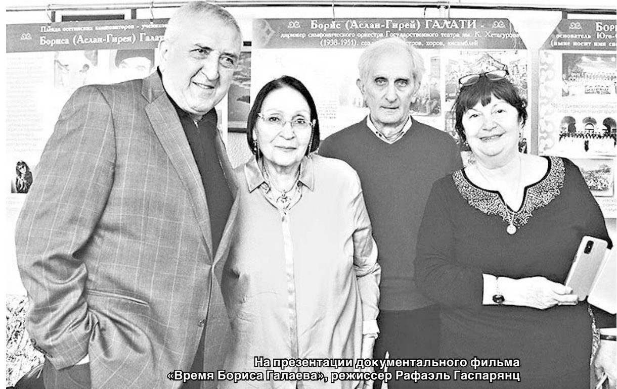
На презентации документального фильма «Время Бориса Галаева», режиссер Рафаэль Гаспарянец

ношения независимо от жизненных ветров. Он любил Осетию, любил всем сердцем, доказывая свое отношение к ней своими творческими работами, своим бережным отношением к коллегам, возвышая свой голос в защиту ее культуры, всегда оставаясь неравнодушным к ее судьбам. Он дарил нам радость истинного человеческого общения, всегда готовый искренне поддержать в любой жизненной ситуации. О таких, как он, говорят: он был настоящим!». Телеграмму соболезнования направил председатель правления Союза кинематографистов России