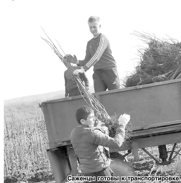
Саженцы готовы к транспортировке

В сельскохозяйственном производственном кооперативе «Де-Густо» не первый год занимаются выращиванием плодовых деревьев.