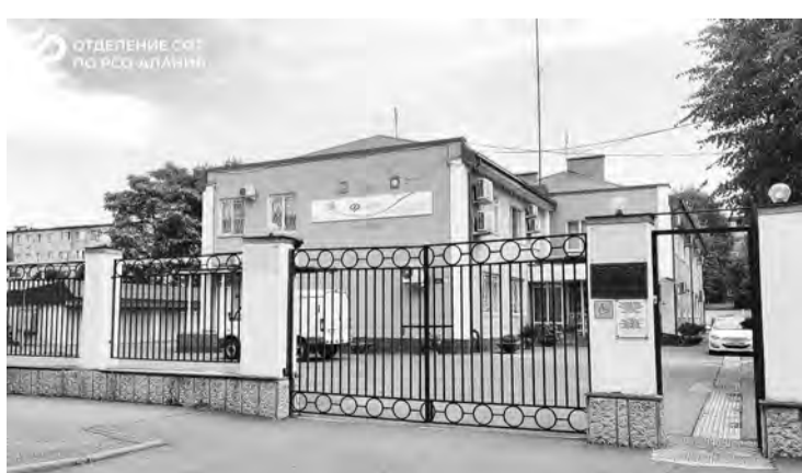
График работы клиентской службы остается прежним: с понедельника по четверг специалисты фонда ведут прием без перерыва с 9 до 18 часов, в пятницу – с 9:00 до 16:45.

ПО ИТОГАМ ПРОВЕРКИ Административную ответственность понес землепользователь за несанкционированную свалку и зарастание сельхозугодий