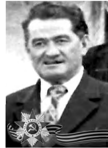
Дзамболат Темирболатович (1909–1983)