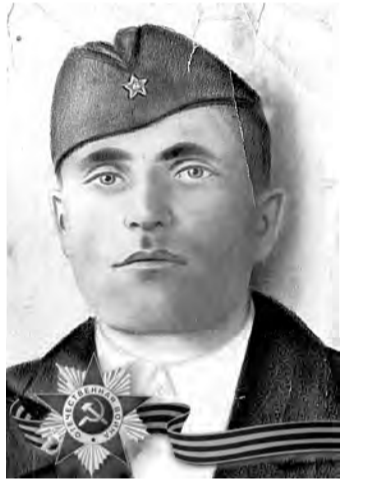
Гаврил Сандрович (1912–1943)