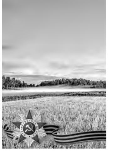
Чермен Темирканович (1911–1943)