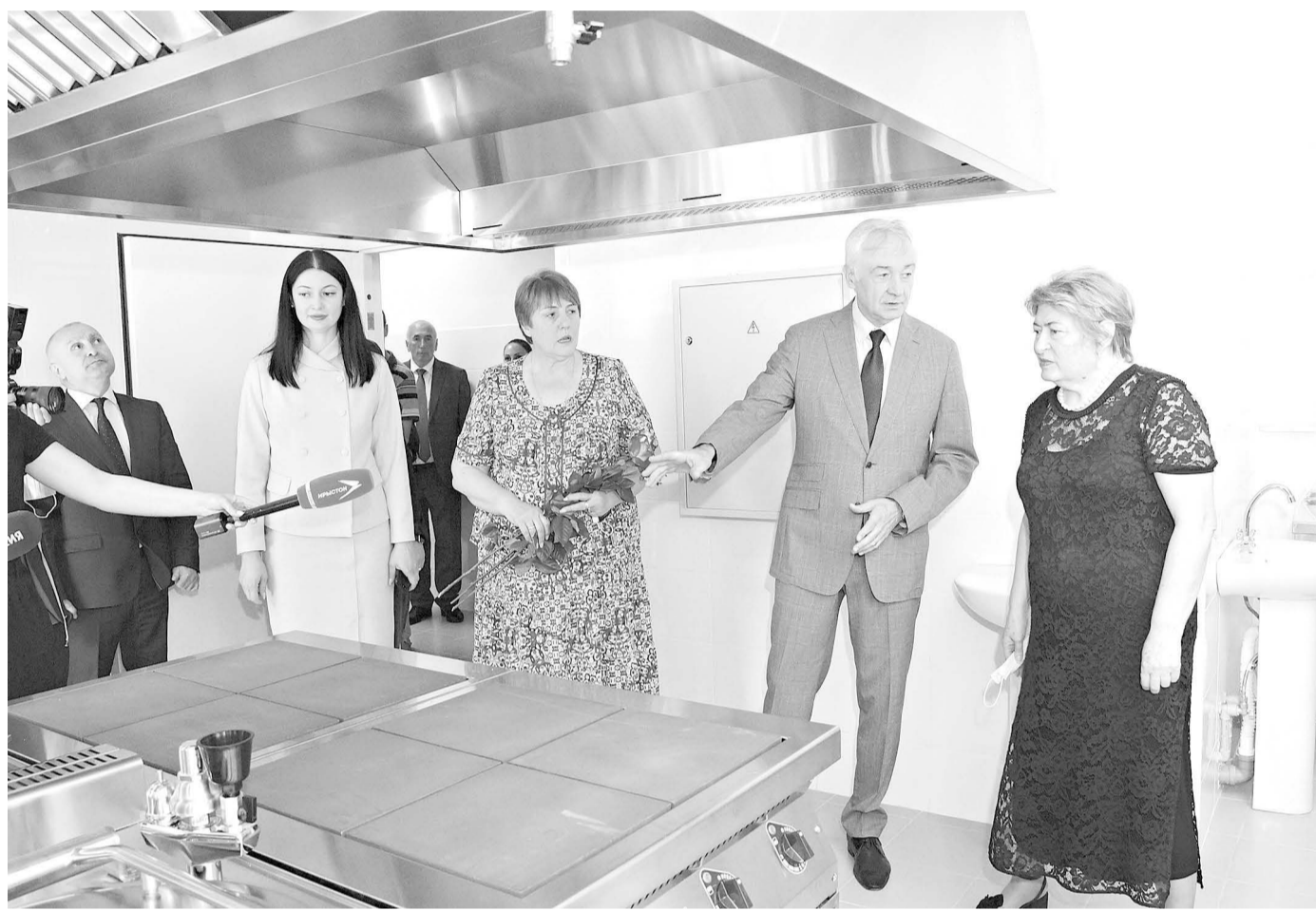
гости. «Сегодня у сотен мальчишек и девочек Владикавказа и их родителей – настоящий праздник!» – обращается к

Поздравить детей и их родителей с радостным событием приехали высокие