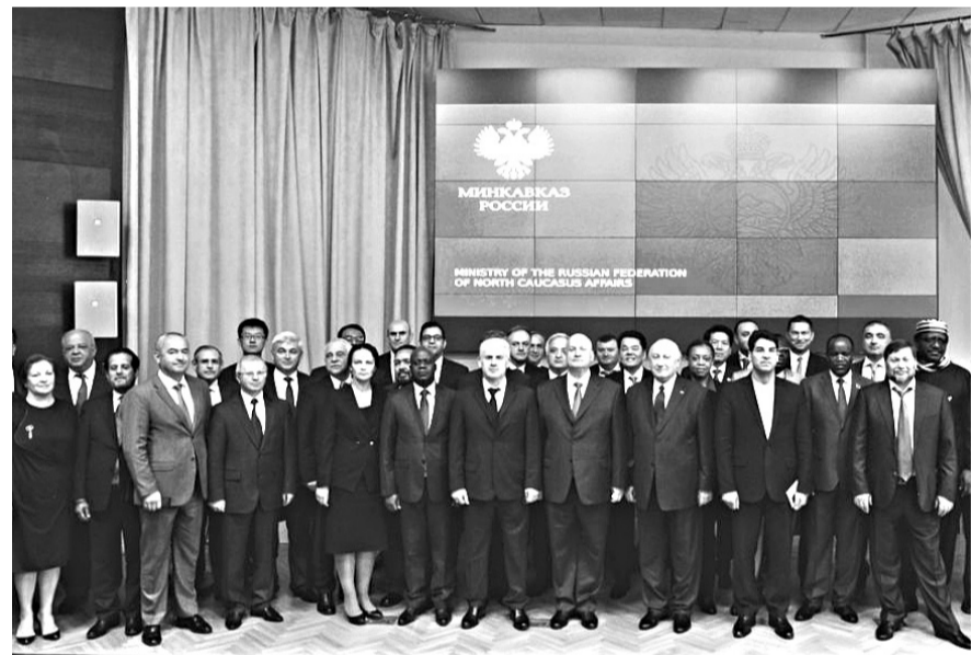
По материалам пресс-службы Главы и Правительства РСО-А.

Председатель Правительства РСО-А Таймураз ТУСКАЕВ, находясь в рабочей командировке в Москве, принял участие во встрече министра Российской Федерации по делам Северного Кавказа Сергея ЧЕБОТАРЕВА с главами дипломатических представительств иностранных государств по вопросам развития инвестиционного и экономического сотрудничества зарубежных стран с субъектами Северного Кавказа.