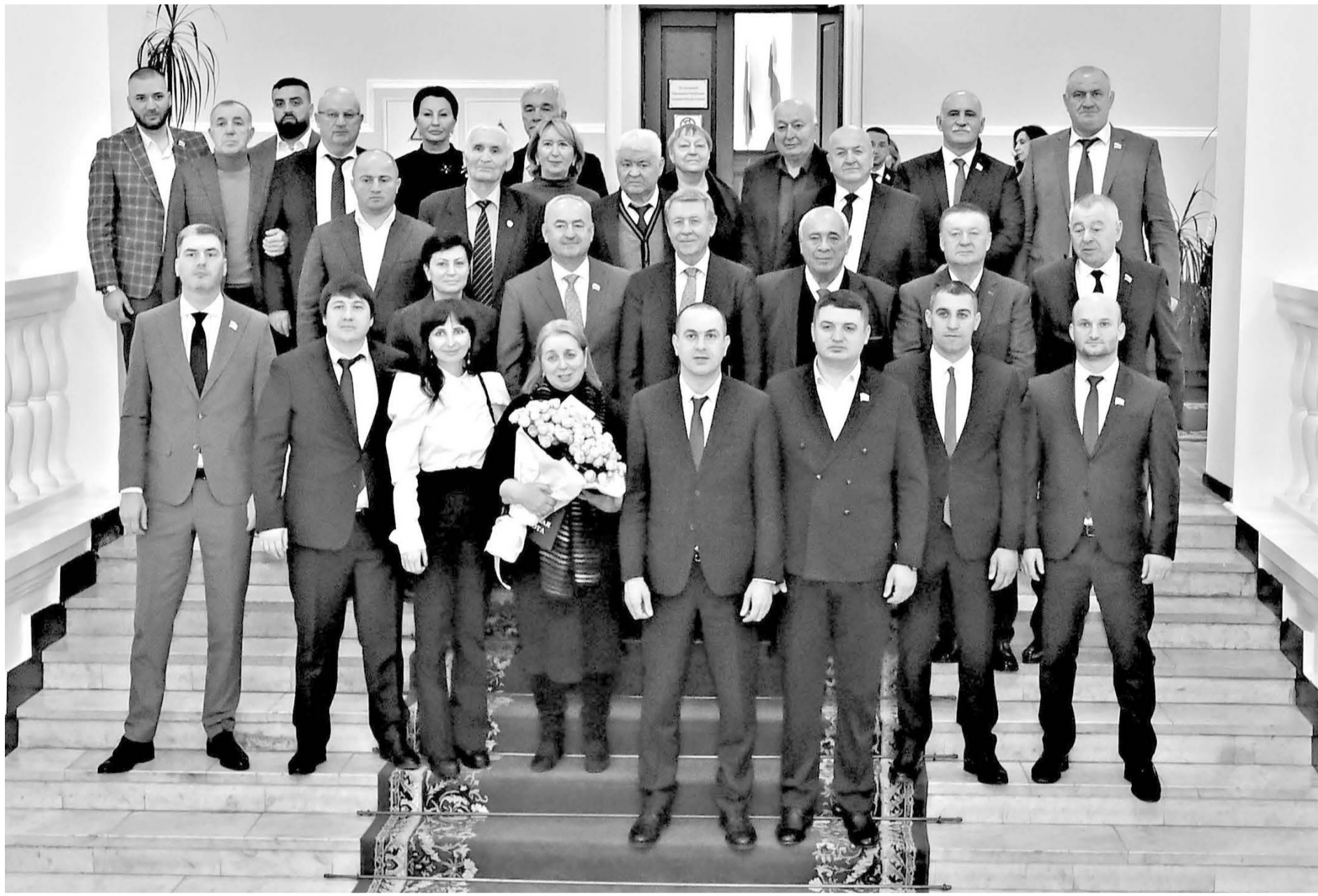
Вчера во Владикавказе состоялась научно-практическая конференция, приуроченная к 30-летию со дня принятия Конституции Российской Федерации.

Валентина ЗЫГИНА.