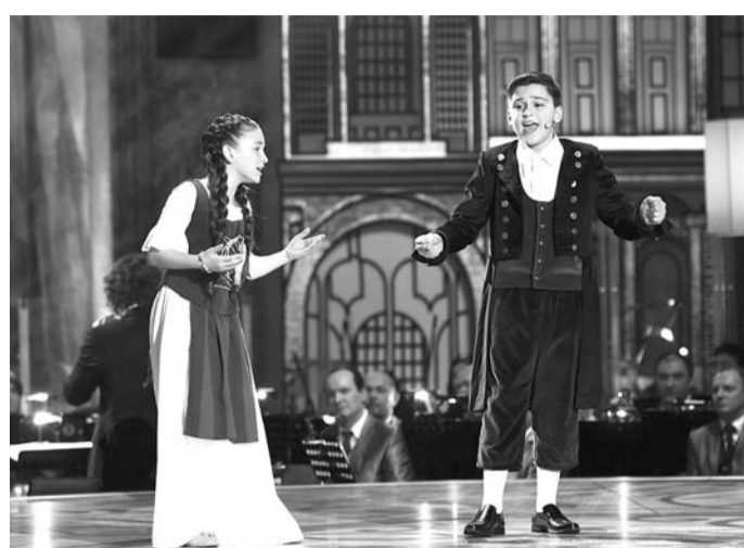
в составе хора, у него возникнет желание солировать».