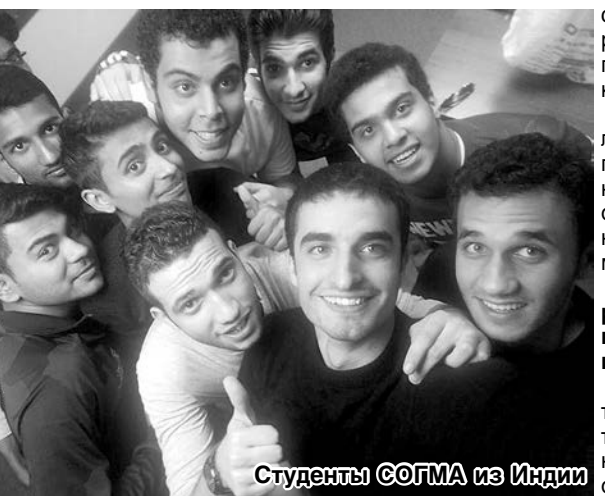
Студенты СОГМА из Индии