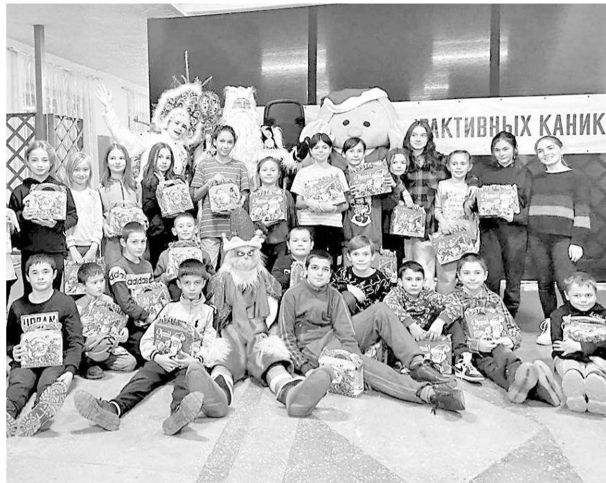
В преддверии Нового года в санатории «Осетия» состоялся утренник для детей вынужденных переселенцев из Донбасса