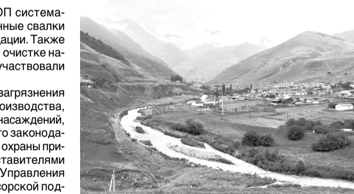
до конца по разным причинам. И эти мероприятия теперь продолжатся в будущем году. Среди оставшихся проблем — нехватка зеленых насаждений

Однако не все, что планировали, удалось довести