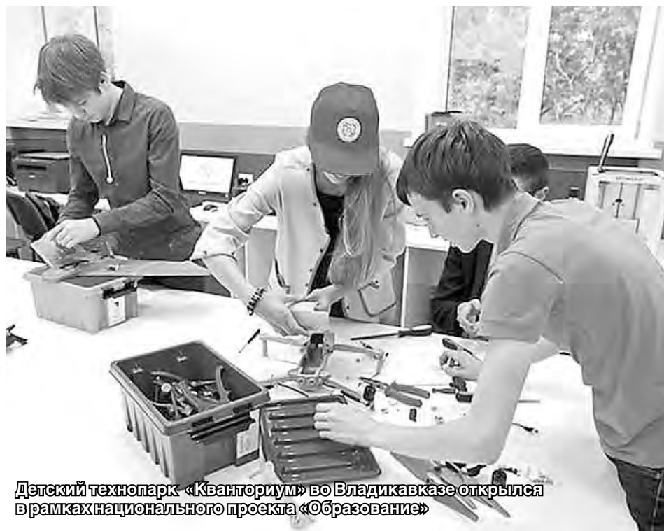
Детский технопарк «Кванториум» во Владикавказе открылся в рамках национального проекта «Образование»

Не исключаем, что для реализации всех нацпроектов исключительно важна уточненность количественных форм функциональных зависимостей, существующих между переменными факторами. Не имея достаточных представлений о таких зависимостях, едва ли будет возможно добиться планируемых результатов. В этом же контексте необходимо является логическая выраженность наиболее существенных задач, которые решаются конкретными нацпроектами. Касательно НП «Образование», нами видится следующая содержательная логика