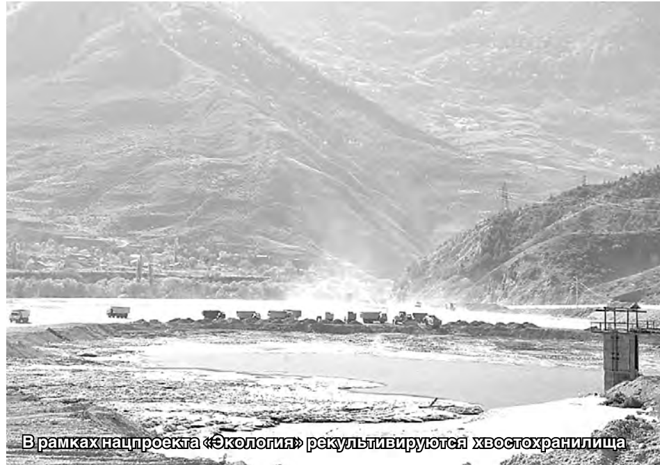
В рамках нацпроекта «Экология» рекультивируются хвостохранилища

тем, как развиваются потребности внутри страны. Это исключительно важно для реальной практики решаемых задач. Например, развивая показатели товарооборота во взаимном мировом интеграционном товарообороте, надо все взвешивать с позиции складывающихся соотношений между импортом и экспортом. Конкурентоспособное товаропроизводство и товаропотребление внутри страны всегда будут положительно влиять на соотношение показателей импорта и экспорта товаров. На начало 2019 года во взаимном товарообороте наших товаров находилось 3,1 процента. При этом Россия по этому показателю занимает 13-е место (449,62 млрд долларов), а в мировом им-