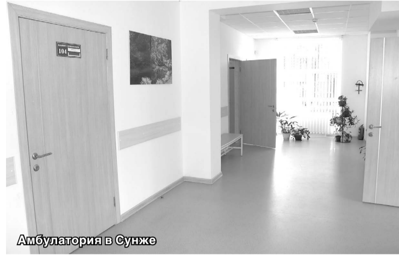
Амбулатория в Сунже