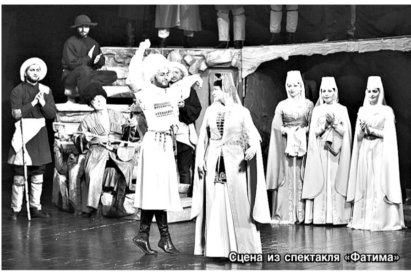
Сцена из спектакля «Фатима»