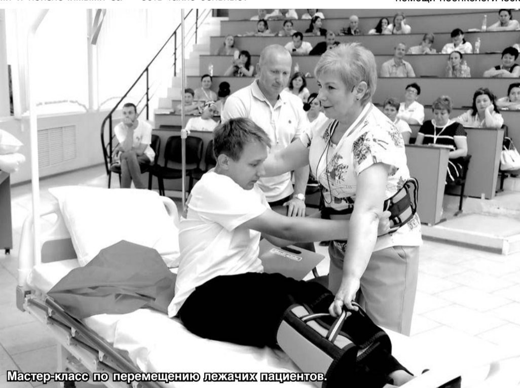
Мастер-класс по перемещению лежачих пациентов.