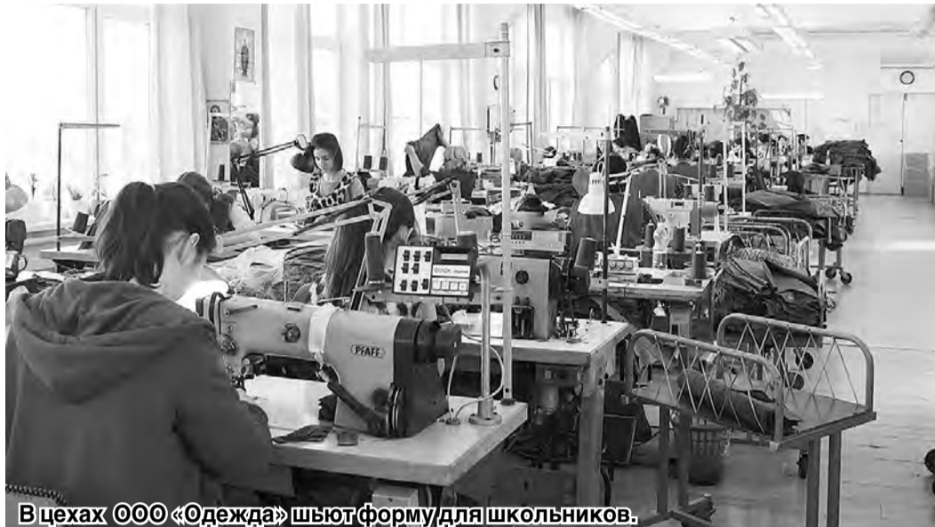
В цехах ООО «Одежда» шьют форму для школьников.

А вот ОАО «Одежда» — основной производитель школьной одежды среди предприятий республики (ассортимент составляет более 40 позиций), член