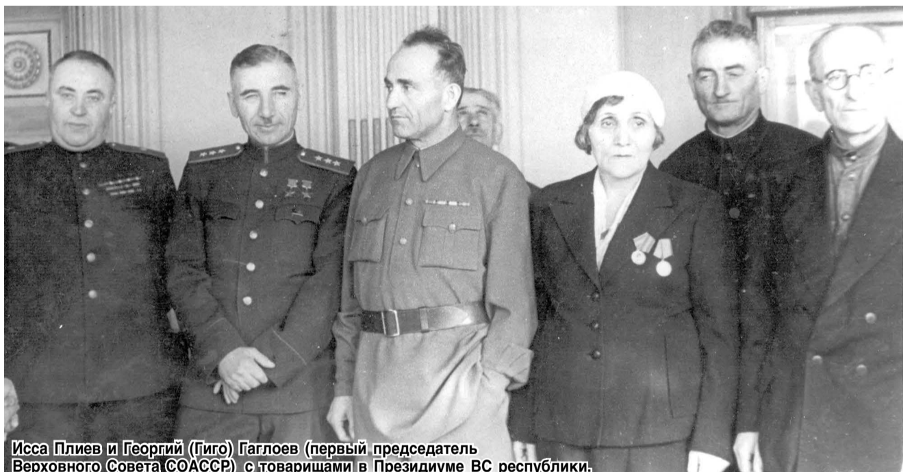
Исса Плиев и Георгий (Гиго) Гаглоев (первый председатель Верховного Совета СООАССР) с товарищами в Президиуме ВС республики.

союзными республиками, как Казахская и Киргизская ССР, ныне независимые и суверенные государства, признанные ООН.