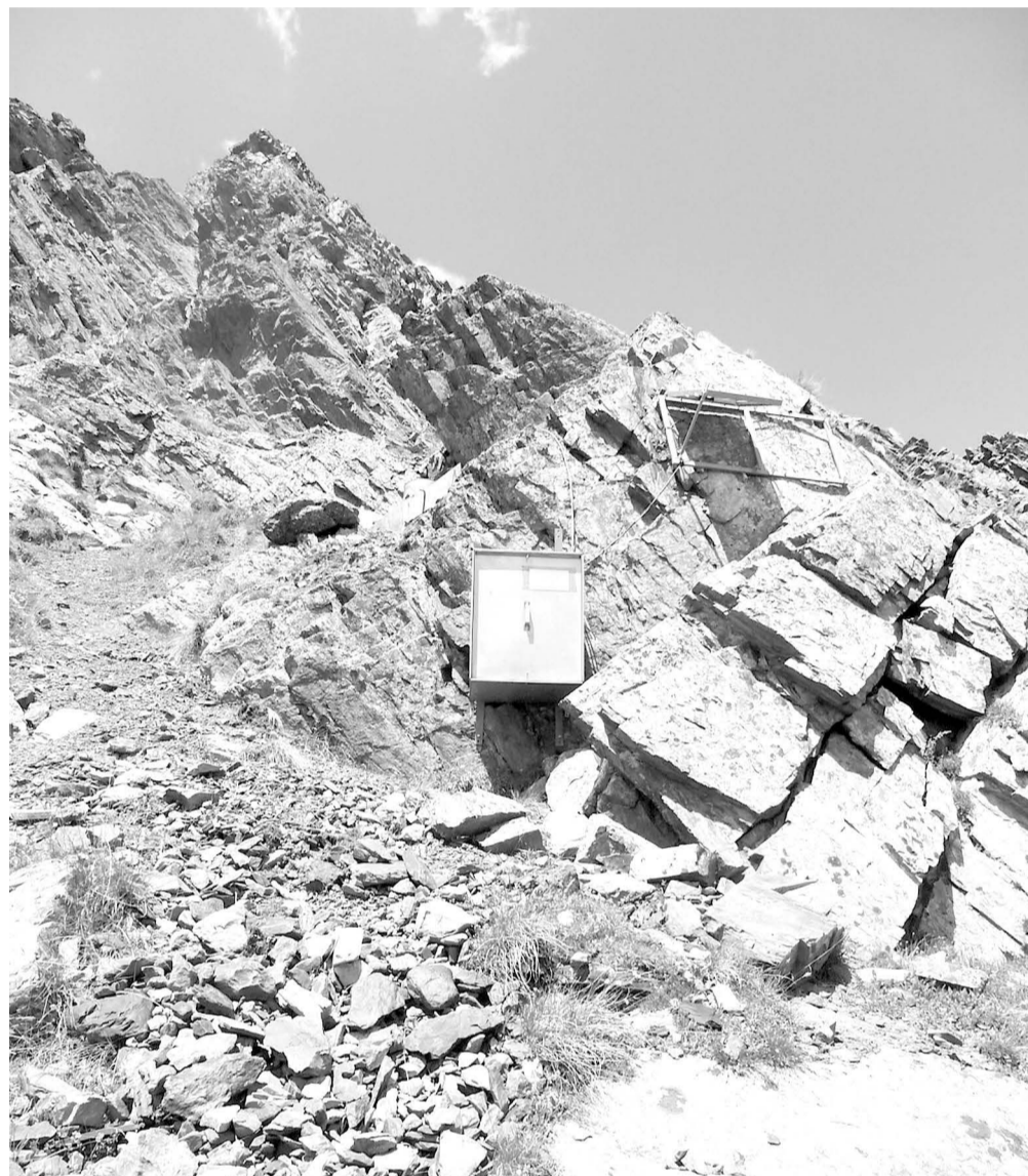
Сейсмическая станция ГФИ ВЦ РАН «Колка». Была установлена вблизи ледника на высоте 2960 м над уровнем моря в 2012 году.

Можно вспоминать трагические события по-разному: рассматривая явление схода исключительно через трагическую призму, а можно, не забывая о прошлом, планировать