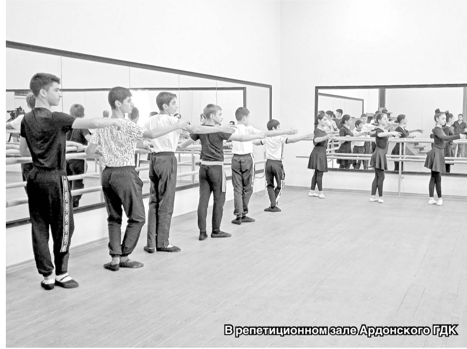
В репетиционном зале Ардонского ГДК

– Такие станки являются неотъемлемым атрибутом любой танцевальной школы, но у нас их никогда не было. Они просто необходимы для опоры танцовщиков во время выполнения упражнений, – сказал