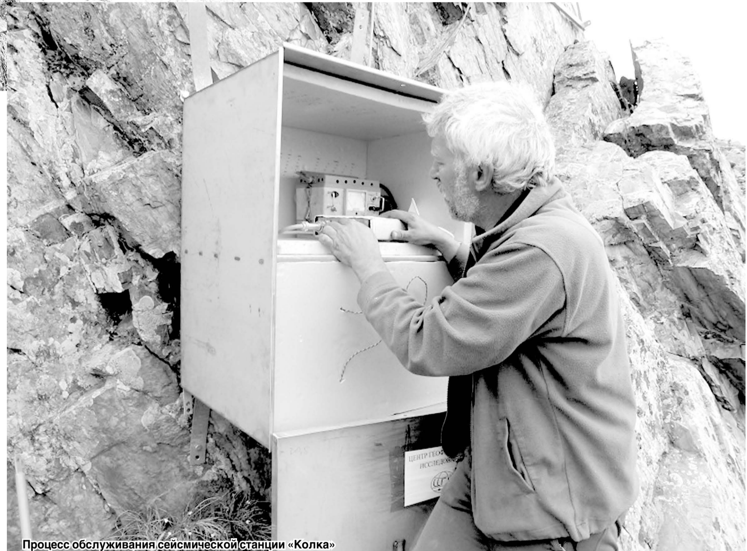
Процесс обслуживания сейсмической станции «Колка»

На основе изучения уникальных инструментальных записей, полученных станциями ГФИ