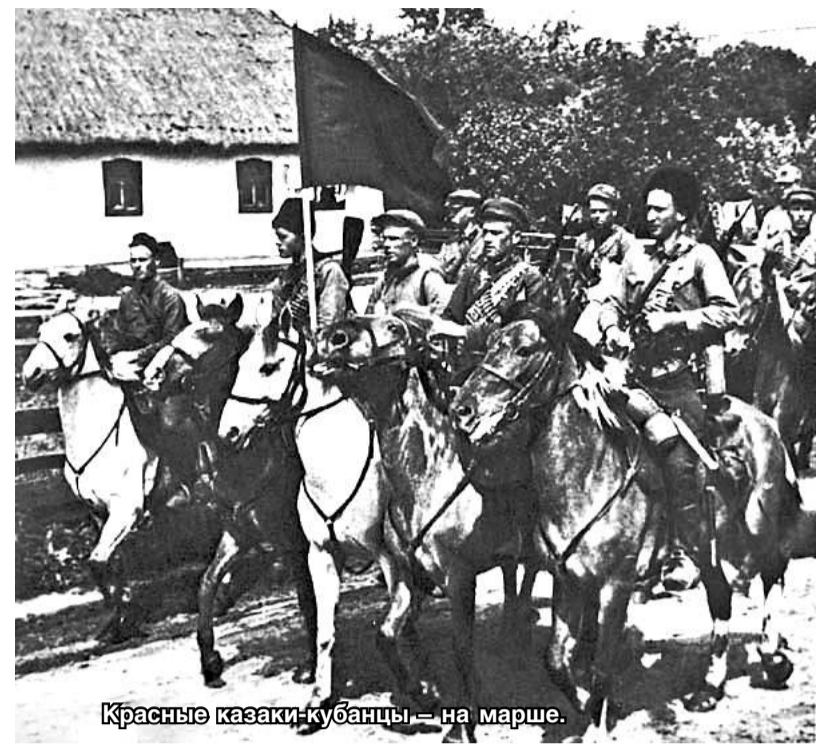
Красные казаки-кубанцы — на марше.