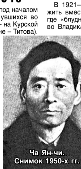
Ча Ян-чи. Снимок 1950-х гг.