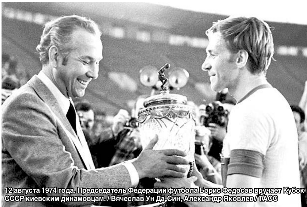
12 августа 1974 года. Председатель Федерации футбола Борис Федосов вручает Кубок СССР киевским динамовцам.

После забкой неуютной улицы внутри оказалось особенно хорошо. Просторные комнаты с высокими потолками, пластиковые столы, по-домашнему уютный свет электрических ламп.