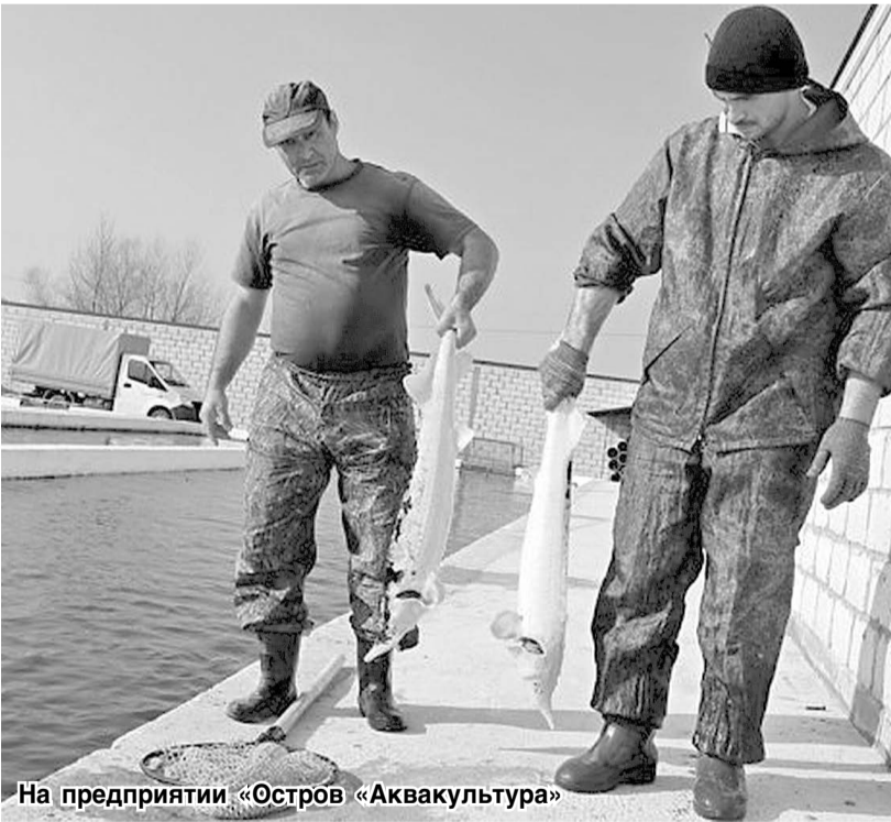
На предприятии «Остров «Аквакультура»

На сегодня в отрасли действуют 63 предприятия, в том числе по разв-