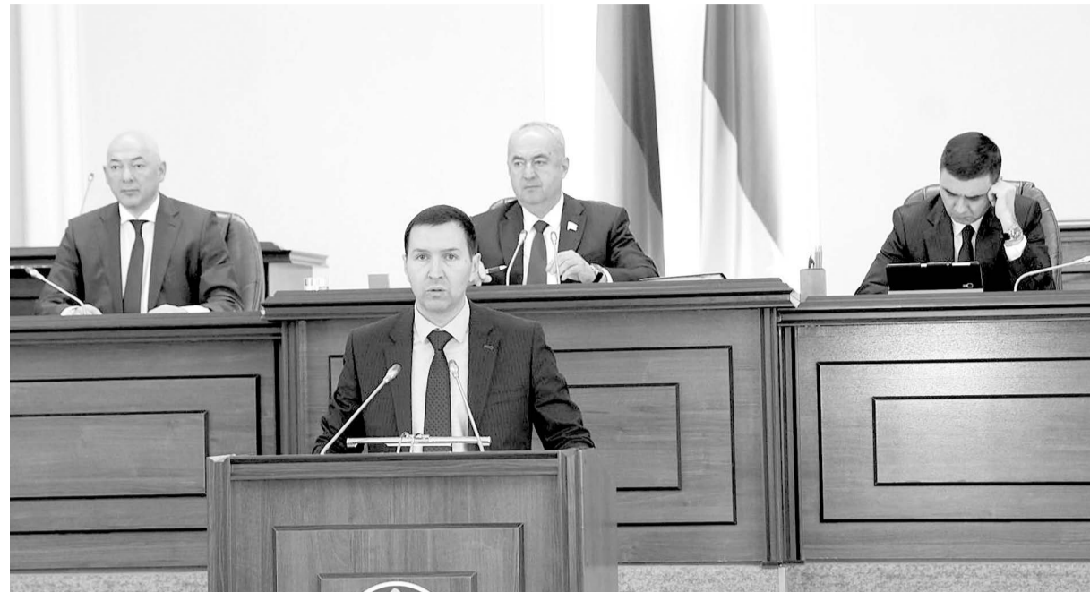
Отдел политики «СО»