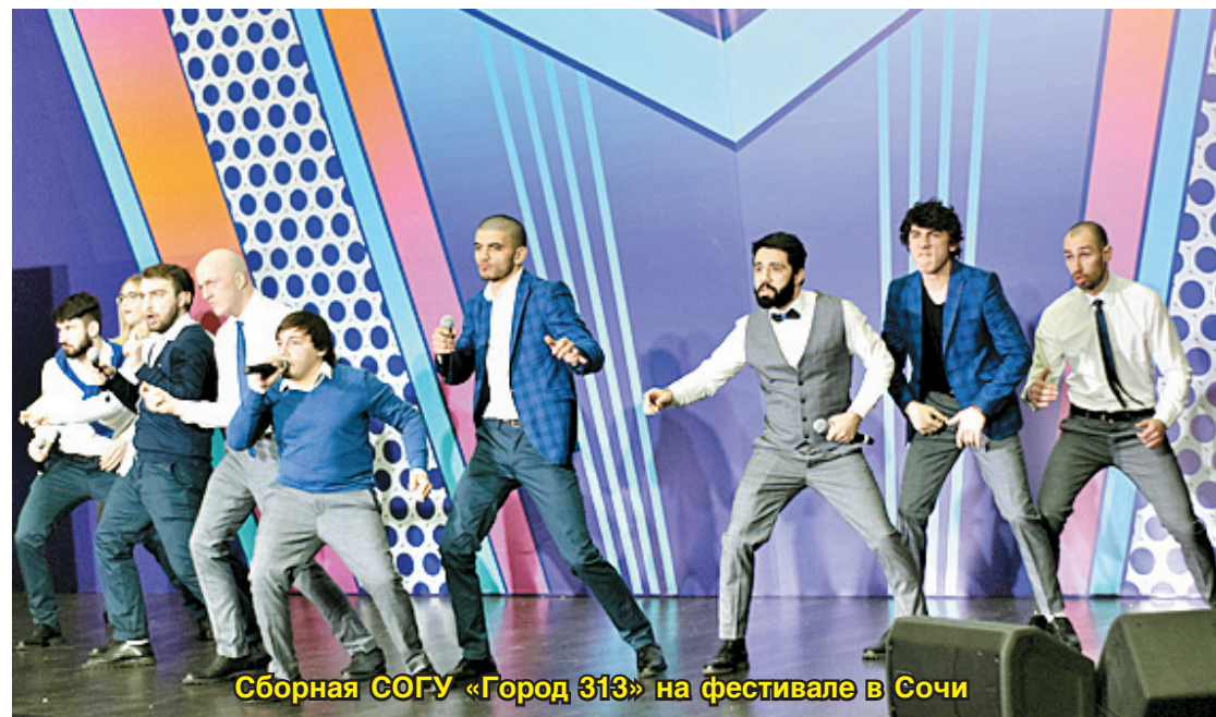
Сборная СОГУ «Город 313» на фестивале в Сочи