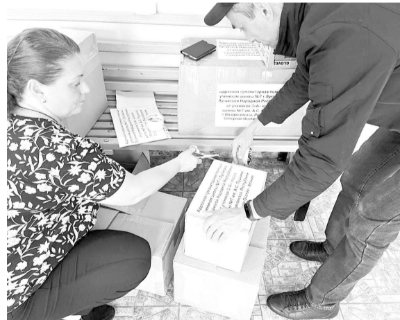
Ученики МАОУ БСОШ №7 им. А.С.Пушкина г. Владикавказа собрали посылки для своих ровесников – учащихся школы № 7 г. Луганска

благодарности: «Как дела? Вы чем занимаетесь в Народном фронте?», я представился, а затем рассказал о нашей деятельности. О том, что в рамках оказания гуманитарной помощи в города Херсонской области мы с добровольцами развозили помощь по отдаленным населенным пунктам под руководством