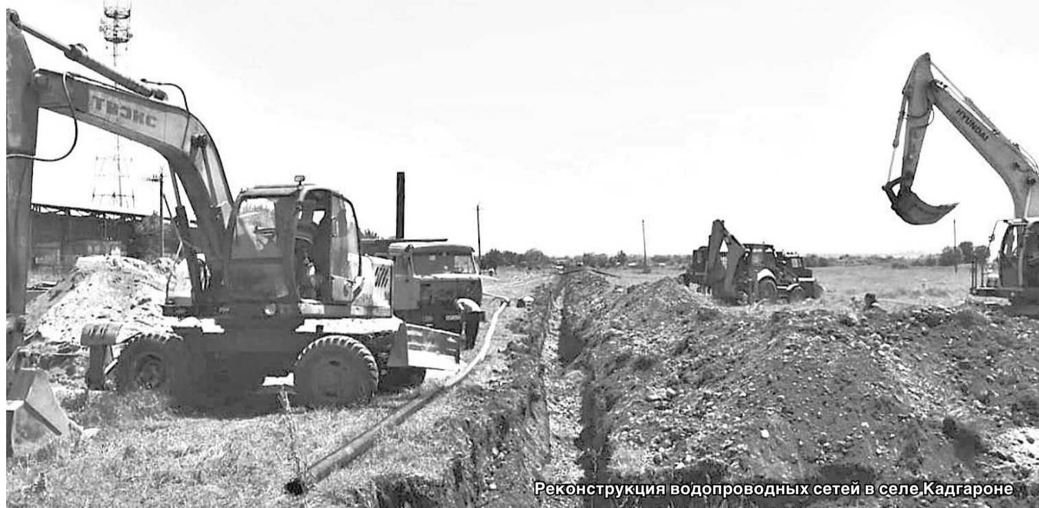
Реконструкция водопроводных сетей в селе Кадгароне

В течение многих лет вся социальная сфера села основывалась на крупных сельскохозяйственных предприятиях — колхозах и совхозах. Реформа отрасли подорвала их возможности, разрушив их. Значительная часть ресурсов и производительности деятельности переместилась из таких предприятий в фермерские и личные подсобные хозяйства.