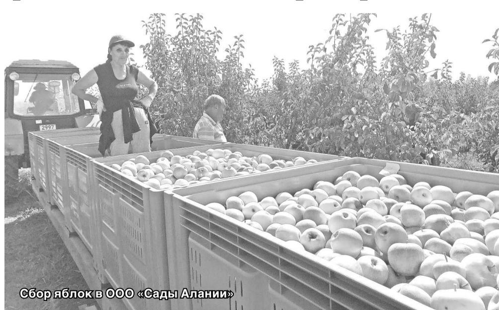
Сбор яблок в ООО «Сады Алании»

Приоритетное направление экономики Кировского района – сельское хозяйство, в том числе производство фруктов, овощей, зерна. В его аграрном секторе действуют 179 сельскохозяйственных кооперативов агрофирм, фермерских хозяйств, а также 130 арендаторов, 6643 личных подсобных хозяйства.