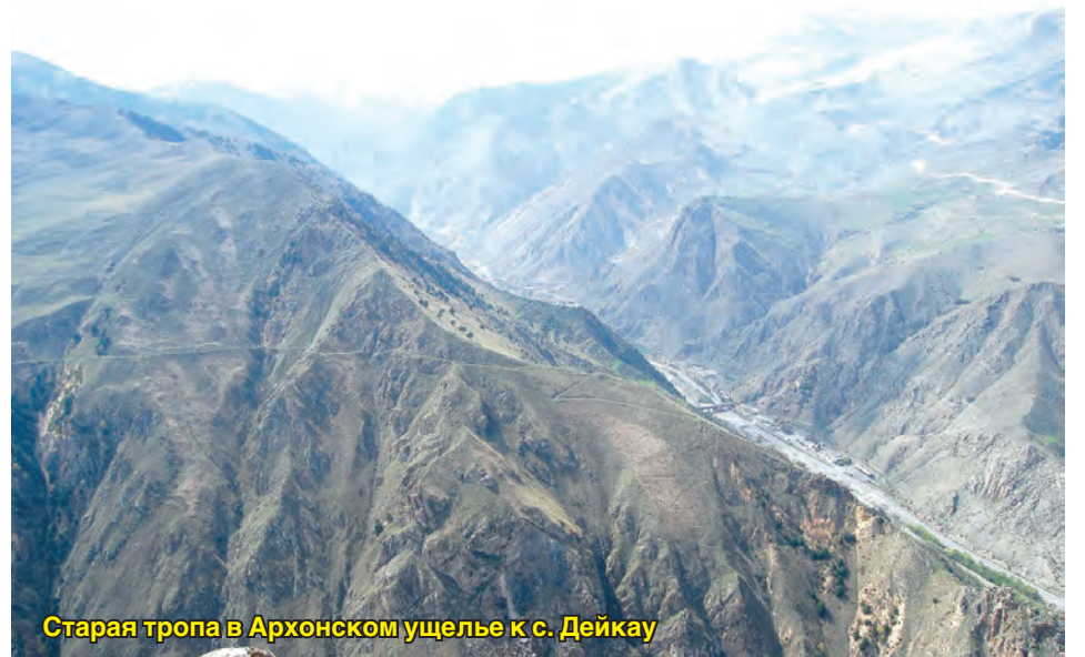
Старая тропа в Архонском ущелье к с. Дейкау

Начало горнорудного дела способствовало строительству более усовершенствованных дорог. Строительство Военно-Осетинской, вызванное необходимостью разработки Садонских рудников, началось в 1848 г. Трасса прокладывалась по Алагирскому ущелью, как отмечалось в газете «Кавказ» за 1851 год, «по старым, едва заметным тропинкам,