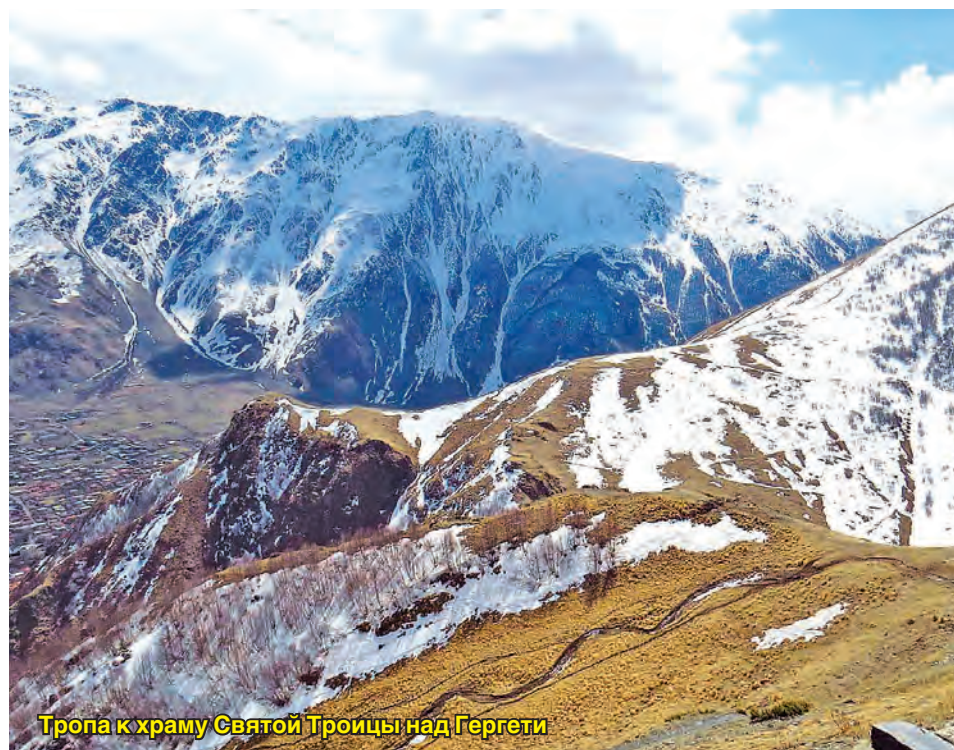
Тропа к храму Святой Троицы над Гергети

гаться по этим крутым и скалистым тропинкам, нужны были невероятные усилия и большое мужество... Общая ширина тропы, служащая главным путем сообщения (в горах) равняется диаметру лошадиного копыта. В некоторых местах на ней не могут разехаться даже два встречных всадника».