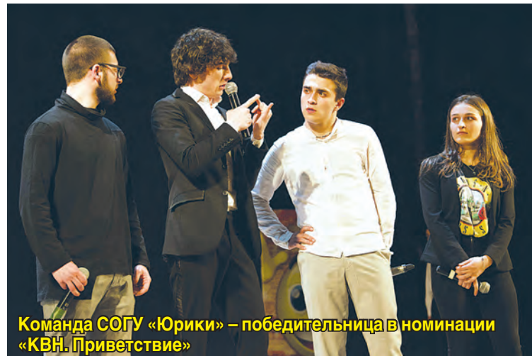
Команда СОГУ «Юрики» — победительница в номинации «КВН. Приветствие»