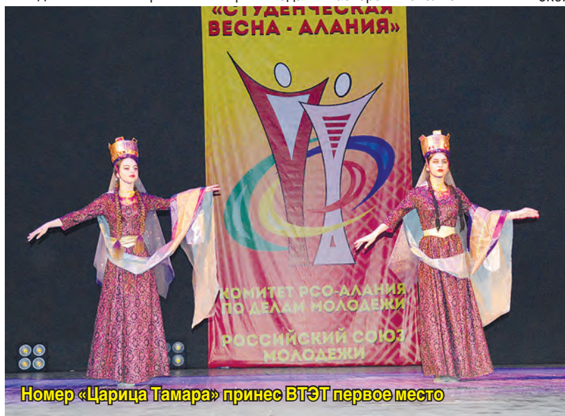
Номер «Царица Тамара» принес ВТЭТ первое место