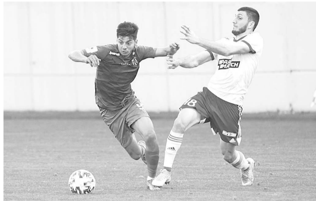
да хорошо известна нашим болельщикам. В 2011 году красно-желтые в 3-м квалификационном раунде Лиги Европы дважды встречались с ней. Тогда в обеих играх была зафиксирована ничья — 1:1, а в серии пенальти (4:2) удачнее были владикавказцы.