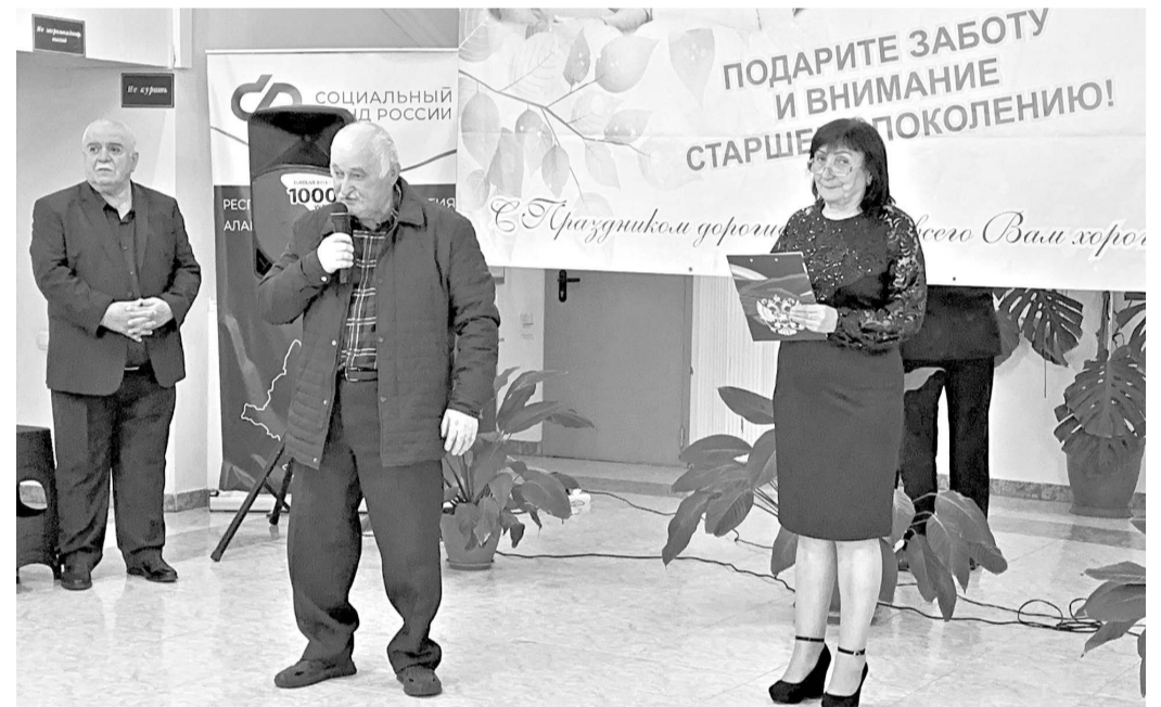
Центр общения старшего поколения при клиентской службе социального фонда в Ирафском районе провел праздничный концерт в честь Дня пожилого человека.