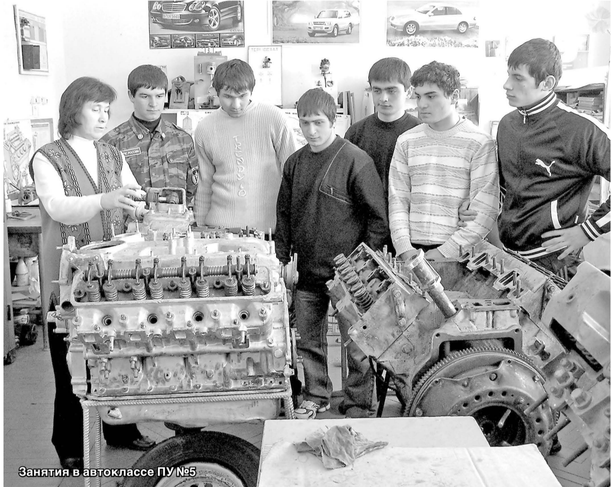
Занятия в автоклассе ПУ №5