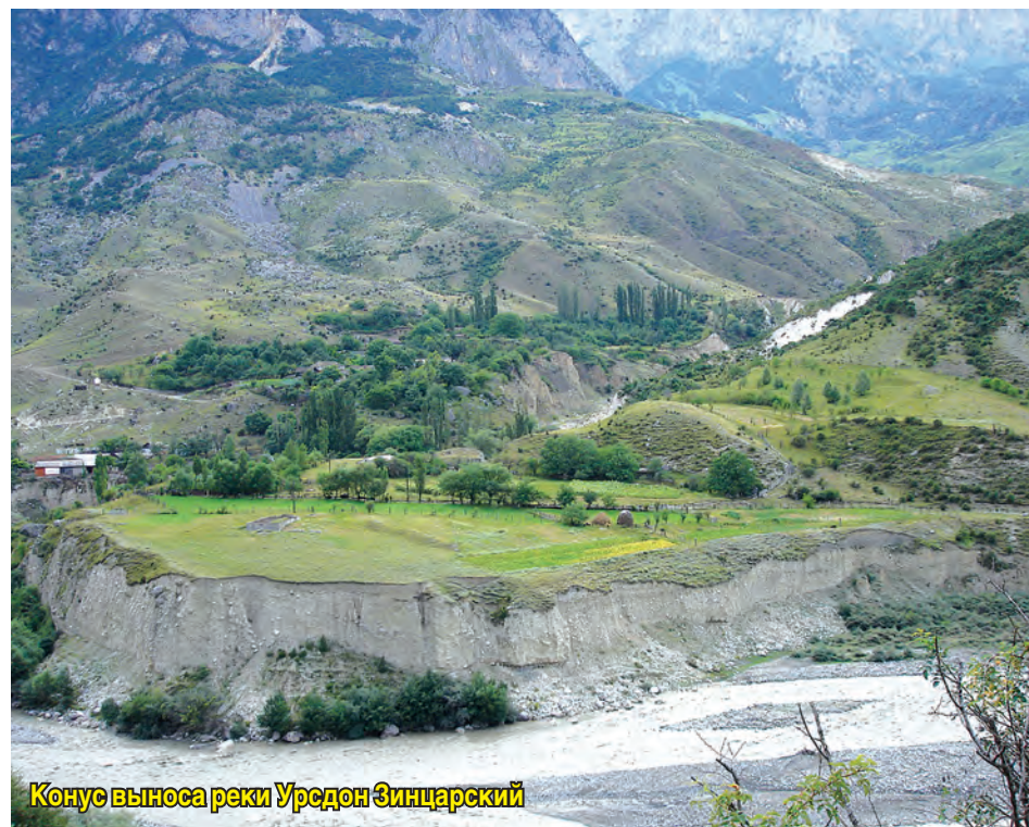
Конус выноса реки Урсдон Зинцарский

О конусах выноса предгорий и Осетинской наклонной равнины отметим следующее. Здесь расположен, пожалуй, самый огромный конус в нашей республике. Осетинская наклонная равнина, к которой приурочен одноименный артезианский бассейн, представляет собой глубокую впадину, заполненную валунно-галечниковыми отложениями. Бассейн сложен толщей рыхлых древних и современных пород. Речные и ледниковые валунно-галечниковые отложения, заполняющие котловину, представляют собой огромный предгорный конус выноса мощностью до 300 и более метров! Он частично наполнен подземными водами.