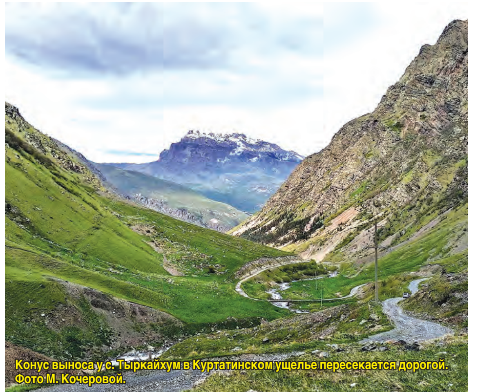
Конус выноса у с. Тырчайхум в Куртатинском ущелье пересекается дорогой.

Гигантские конусы выноса есть в Куртатинском ущелье и его верхней части – Хилаке. Здесь они выползают с обоих бортов – производят подпор реки, и выше них –