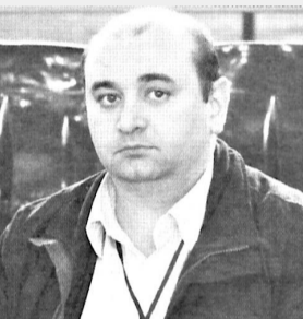
СЛОВО • ТВОРЧЕСТВО • КНИГА